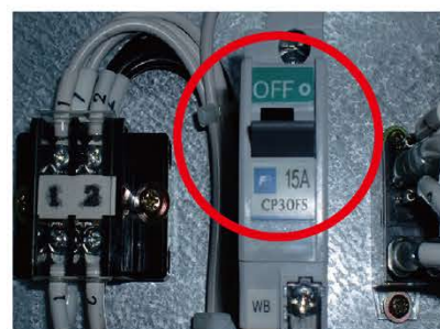
モーターに負荷がかかると内部ブレーカーがOFFになり、電源ランプが点滅します

機械内部の凍結によってモーターに負荷がかかり、機械内部にあるブレーカーが「OFF」になっている時にランプが点滅します。機械内部のブレーカーを「ON」にし、ランプが点灯すれば、解決です。それでも水、泡が出ない場合は、左記の方法を行ってください。