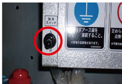
放水スイッチを入のままで、高圧ホースより水が出るまで待ちます