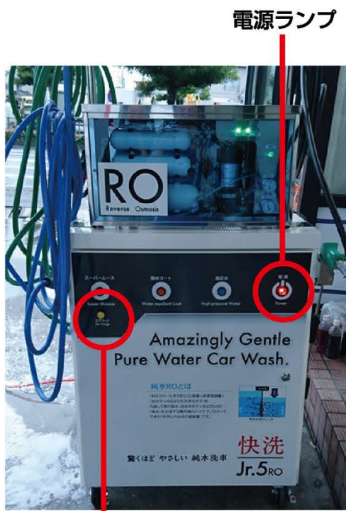
エアージェットボタン