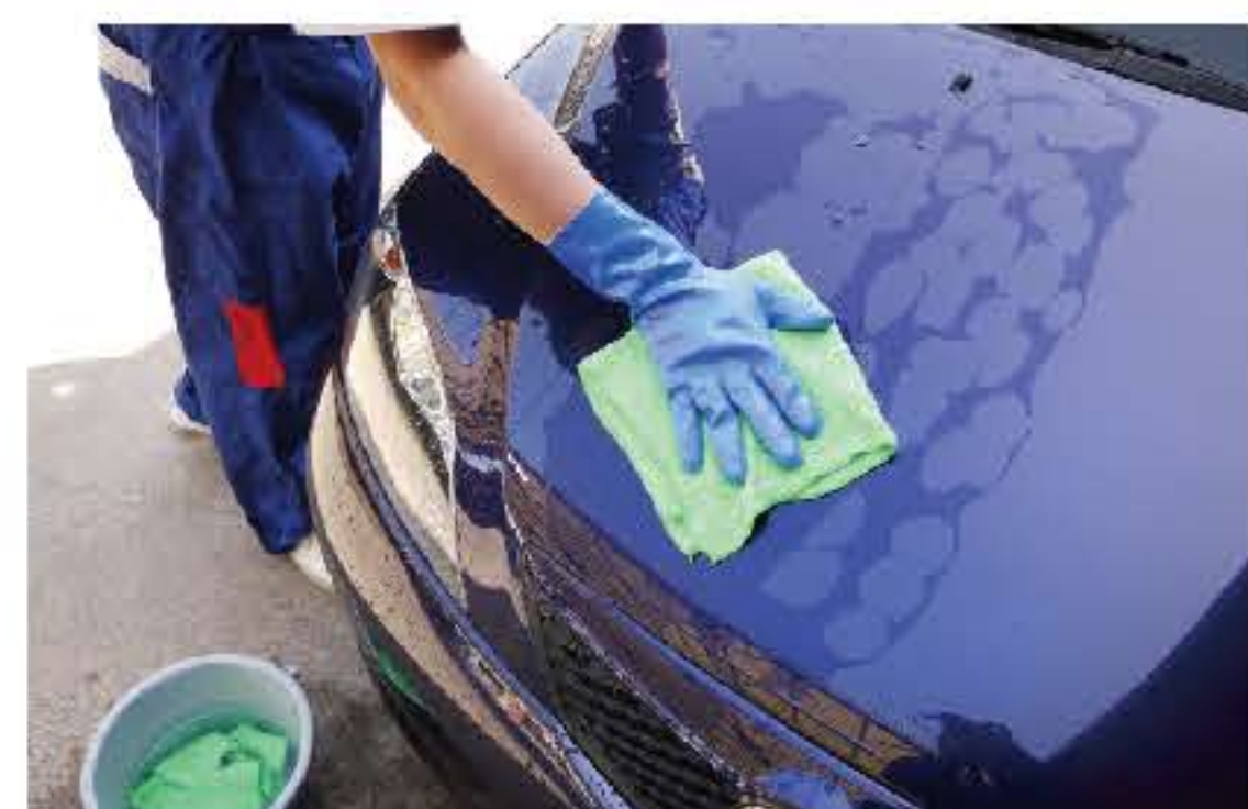
バケツからキークロスを取り出し、絞らずにボディを拭き上げます。キレイになったら乾いたキークロスで仕上げます