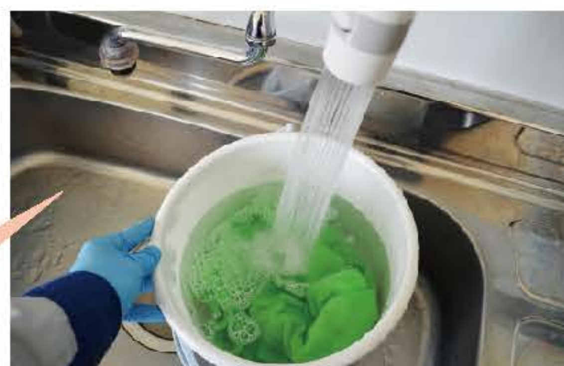
バケツにお風呂より少し熱いお湯(50℃くらい)を汲み、キークロスを濡します

A 花粉がついて、少し時間が経ってしまい、洗車しても落ちない場合は、50℃程度のお湯にキークロスを濡らして絞らずにそのまま拭き取ります。キレイになったら、乾いたキークロスで拭き上げます。