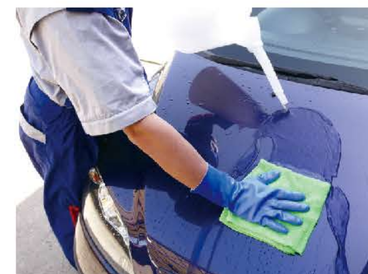
70℃以上のお湯をかけてキークロスで拭き取ればすっきり!

A 50℃のお湯でも取れない場合、ボディにキークロスを敷いて、70℃以上の熱いお湯をかけ、10分～15分蒸らし、ボディの温度を上げることでペクチンを除去します。キレイになったら、乾いたキークロスで拭き上げます。