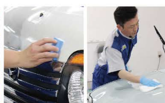
拭き取りは、1回で拭き取り、2回目で仕上げることを意識して、早く動かし過ぎると拭き切れないうちがあるので、確かながら的確に拭き上げます。