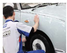
洗車で落とせなかった鉄粉を除去します。

新車と経年車では工程が異なります。塗装の状態を見ながら、しっかりと汚れを落とし、下処理を行います。仕上げ時はしっかりと拭き上げ、水気を残さないように注意します。