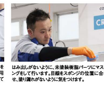
はみ出しがないように、未塗装樹脂パーツにマスキングをして行います。目線をスポンジの位置に合わせて、塗り漏れがないように気をつけます。