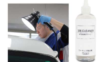
施工後、はみ出しや拭き残しが見つかった場合、326クリーナーを使って除去し、1パネル分の範囲をプライマーガラスからやり直さなくてはなりません。1パネルごとにEXライトで塗り漏れ、拭き残しがないか確認し、やり直さずすむように慎重に施工します。