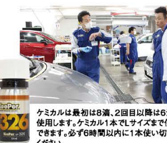
ケミカルは最初は8滴、2回目以降は6滴を使用します。ケミカル1本でLサイズまで使用できます。必ず6時間以内に1本使い切ってください。

樹脂部分につかないようにマスキングをし、1パネルごと(約50cm×50cm)に施工します。はみ出しを防ぐため、先にドア・ステップまわり→ボディの順で行います。拭き上げは3回で行い、その都度EXライト(塗装が濃い色の場合はEXボードでも)で拭き残しがないか確認して慎重に行います。