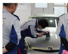
経年車で、納車から1ヶ月以上または1,000km以上走行している場合には軽研磨をします。塗装が著しく劣化している場合は、鏡面研磨を施します。