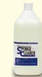
キーパー スポンジクリーナー 4,950円(税別)