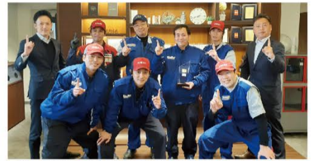
元氣いっぱい馬事公苑SSの皆さんは、すでに2023年12月のキーパー選手権2連覇に向けて活動をはじめています!

駐車環境をお伺いすると、圧倒的に屋外保管が多く、そんなお客様には汚れにくく、洗車回数も圧倒的に減る「ECOダイヤ」がぴったりです。ツヤも触り心地も良いのでお客様の満足度も抜群に高いです。ECOシンの作業性も抜群に良いので、当店が一番のおすすめは「ECOダイヤ」になりました。