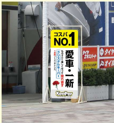
【スクリーンシート】 W740×H1,785mm

有料で横断幕、スクリーンシートの両方ともご注文いただけます。 下記ご注文書にてご注文ください。