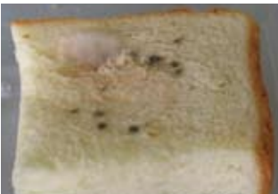
パンに発生したカビ

6万以上の種類があるといわれているカビ。カビは「菌糸」と「孢子」からできており、気温や湿度、養分などの条件が整うと、「菌糸」が成長しながら「孢子」を撒き散らしていきます。カビが厄介なのは、食品を腐敗させるだけでなく、「カビ毒」による食中毒、アレルギーによる喘息、また体内に侵入して皮膚糸状菌症などの感染症を引き起こすことがあるからです。