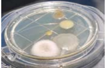
車内に蔓延する様々な雑菌

今年4月、「O-111」による集団食中毒事件が発生しました。普段「コンビニ感覚」で利用している身近な外食チェーン店で発生したことや、多数の死者が出たこともあり、現在も大きな関心が寄せられています。キーパーコーティング施工店で使用されている強力な除菌・消臭効果をもつ「オールクリア」の500mlボトルが新発売!私たちが提案するキーパーコーティング、そのコンセプトは「愛車を守る」です。紫外線や黄砂などの外的要因から車の塗装を守り、美観を維持することはもちろん、雑菌から車内を守り、利用者の安全と安心も守ります。