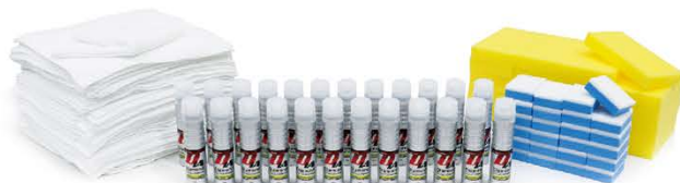
▲ ダイヤモンドキーパーケミカル Lセット

ゴミを減らし、送料を減らすことでコストダウンとエコ効果を図るため、大容量の「LARGE(ラージ)セット」が登場! ダイヤモンドキーパーケミカルやレジン2、キーパーファイナル1など13種の「LARGEセット」をご用意しました。同梱の発注書でご注文ください。