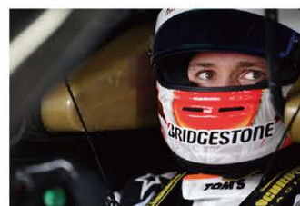
サッシャ・フェネストラズ選手 7歳からレーシングカートをはじめ、4輪デビューは16歳。フランスF4選手権で3勝シリーズ2位。2017年フォーミュラ・ルノーユーロカップでチャンピオン。2018年マカオグランプリで3位表彰台。2019年全日本F3選手権でチャンピオン。