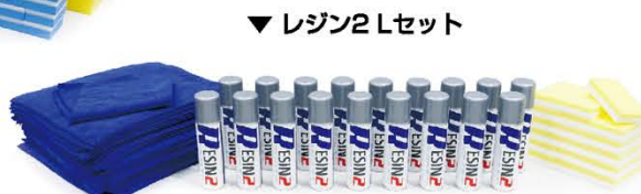
▼ レジン2 Lセット