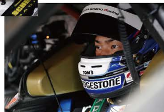
2007年からレーシングカートをはじめ、翌年に全日本ジュニアカート選手権でデビューウィンし、タイトルを獲得。2015年よりSUPER GT500クラスに参戦。2017年にはニック・キャンディー選手と組んで最年少コンビ(23歳)でチャンピオン獲得。