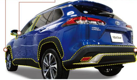
【施工箇所】 無塗装樹脂フェンダー・ワイパーカウル・メッシュグリル等