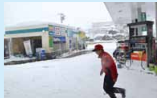
写真左の連続洗車機トンネルが雪のコーティングブースに