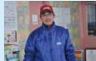
和徳新道SS丹藤店長

雪が降っている最中、連続洗車機はほとんど稼働しない時にクリスタルキーパーをバンバン施工していた。連続洗車機のトンネルの中が雪がつかなくて、ちょうどコーティングブースのように見えたのか、誰が始めてともなく、連続洗車機の中でクリスタルキーパーをかける姿があった。それを誰も不思議な光景とは思わなかった。