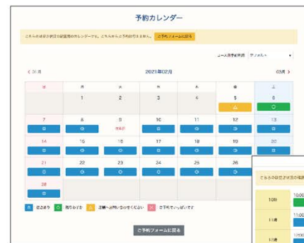
◀お客様から見た1カ月分の店舗予約状況画面(パソコン画面)