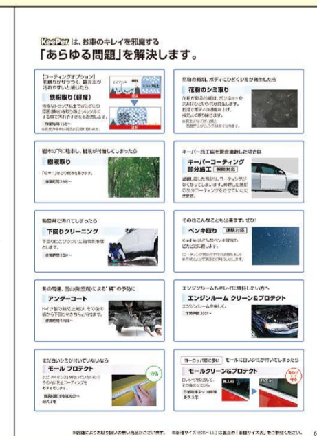
《6P》クリーニングその他