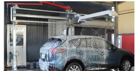
泡は、風で吹き飛ばないように比較的重い泡に調整してあります。全体が軽くなってシンプルになり大幅なコストダウンにつながります。