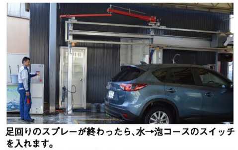
足回りのスプレーが終わったら、水→泡コースのスイッチを入れます。