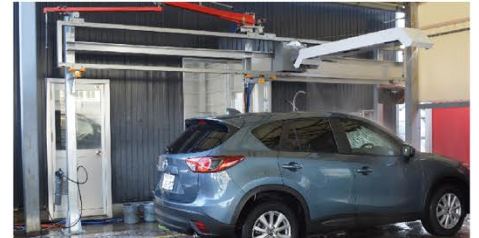
水と泡が出るブームは水平の一本のみとし、吹き出しノズルの角度を吟味して、前後横も洗えるようにして垂直の可動ノズルを廃止。ブームが移動する速度は自在に変えられます。