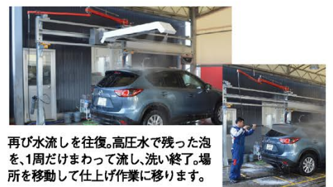
再び水流しを往復。高圧水で残った泡を、1周だけまわって流し、洗い終了。場所を移動して仕上げ作業に移ります。