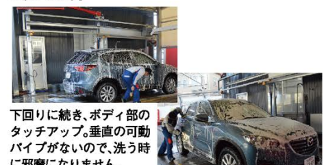
下回りに続き、ボディ部のタッチアップ。垂直の可動パイプがないので、洗う時に邪魔になりません。