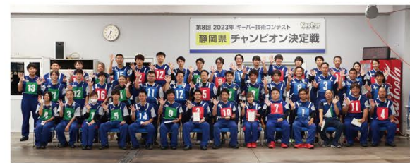
第8回 2023年 キーパー技術コンテスト 静岡県 チャンピオン決定戦

選手が上位となる。チェック項目は全部で37項目。中でも7点満点の項目が10項目ある。①爆ツヤ前の下地処理ができてい