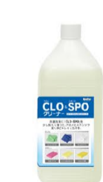
「クロスボククリーナー」 価格:5,200円(税別) 内容量:3L